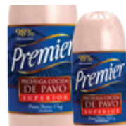
Pechuga de Pavo Superior