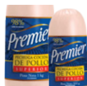
Pechuga de Pollo Superior