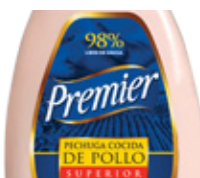
Pechuga de Pollo Superior