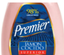
Jamón Cocido Superior