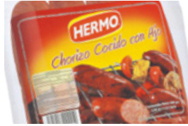
Chorizo cocido con ajo