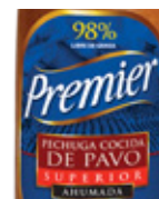
Pechuga de Pavo Superior Ahumada