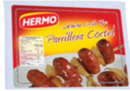
Salchicha Cocida tipo Parrillera Córdobá