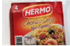
Chorizo Seco tipo Español