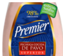
Pechuga de Pavo Superior