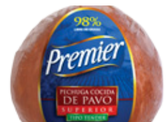
Pechuga Cocida de Pavo Superior tipo Tender