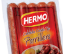
Salchicha Cocida tipo Parrillera