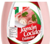
Jamón Cocido Estándar