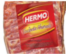
Tocineta Ahumada sin cuero