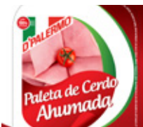
Paleta de Cerdo Ahumada